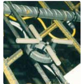
Til måling af CorroWatch multisen- sor eller "anode-ladder"